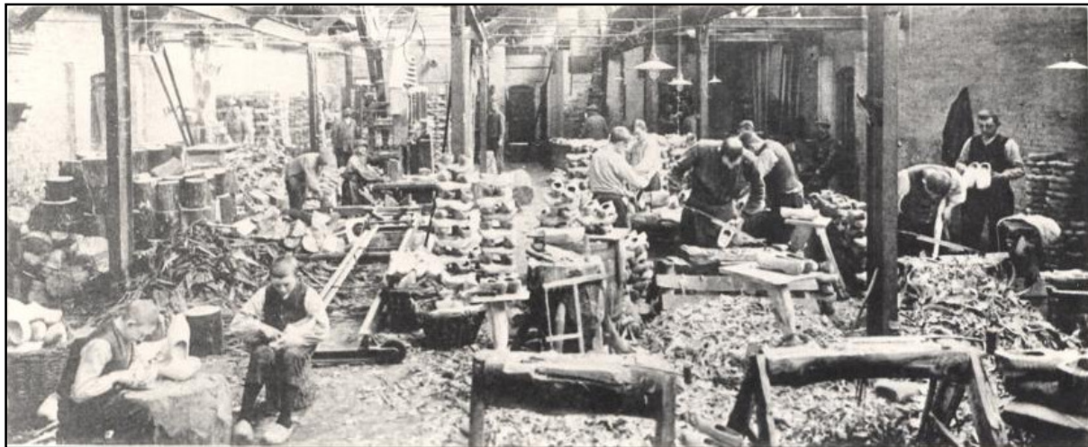
Op de foto werknemers van de stoomklompenfabriek van de familie Brox aan de Schijndelsedijk [NCB-laan]. In 1922 werd de fabriek verkocht 78 . Later was er Fiat-garage Van Den Dungen gevestigd.

Het stereotype beeld van het Meierijsse klompenmakerdorp is voor Veghel grotendeels verloren gegaan in de twintigste eeuw toen door de gigantische industrieontwikkeling allerlei nijverheden de kleinschalige klompenindustrie verdreven. Opvallend genoeg bleef de klompenfabricage tenslotte niet achter bij de industriële ontwikkelingen van Veghel; de klompenfabriek van de familie Brox aan de Schijndelsedijk [nu NCB-laan] was in 1912 één van de acht machinale klompenfabrieken in de provincie Noord-Brabant en de enige in de regio. 77