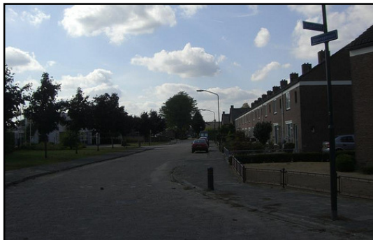
De Violenstraat is aangelegd over het tracé van de Rooisedijk. Van de oude bebouwingsclusters is niets meer te herkennen. Ze verdwenen wegens sanering.