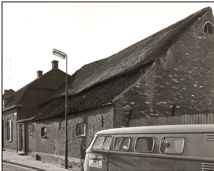
Deze rietgedekte boerderij aan de Havenstraat stond ter plekke van het cijnsgoed Groenendaal. Het was het enige pand dat tenslotte herinnerde aan het oude agrarische buurtschap Hoogeinde. In 1950 was het nog één grote boerderij, maar reeds voor 1960 werd de helft afgebroken. Het restantdeel op de foto werd in 1964 afgebroken voor de aanleg van de Asterstraat.