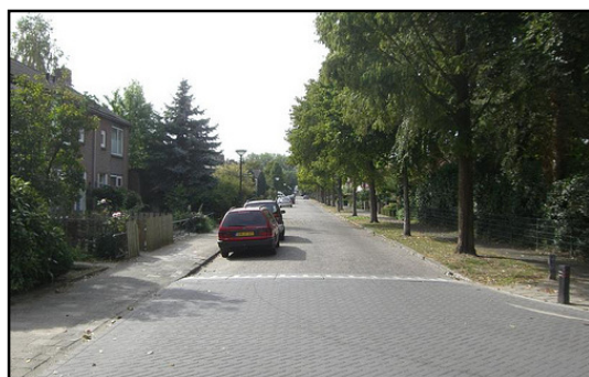
Op de overgang tussen de Lelielaan en de Chrysantenstraat begon vroeger de oude Eerdse Dijk. De Chrysantenstraat volgt hetzelfde eeuwenoude traject.