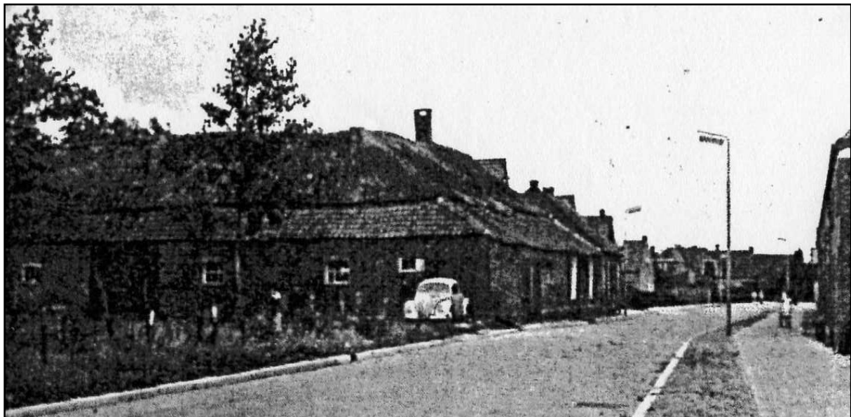
De Rosoliemolen in de Leeuwenbekstraat, gefotografeerd aan het eind van de jaren '50 vlak voor de sloop. Het gebouw op de foto lijkt een zogenaamde krukboerderij te zijn. Achter de brede voorgevel ligt het woongedeelte met haaks daarop het bedrijfsgebouw [de oliemolen?].