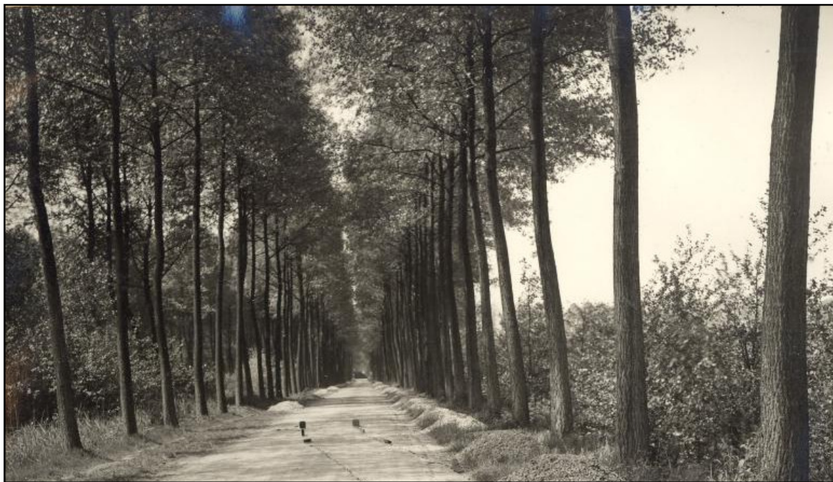
Typisch negentiende-eeuws landschapsbeeld in Veghel-West. Ongelooflijk maar waar, het zandpad op de foto is de voormalige Schijndelsedijk in 1927 [nu NCB-laan], in de negentiende eeuw onderdeel van De Putten. Tegenwoordig wordt het straatbeeld bepaald door woningen en fabrieken als DMV, maar in de jaren '20 was dit nog een peppellaan. Na de aanleg van het kanaal werd de oude weg naar Schijndel doorsneden en liep het verkeer naar deze plaats via de Sluis. De Oude Veghelsedijk te Wijbosch draagt als restant van deze voormalige verbinding Schijndel-Veghel nog altijd het karakter van een peppellaan.

Overigens werd de aanplant in Veghel niet alleen karakteristiek voor nieuwe ontginningen als De Putten en De Dubbelen; ook de dreven in eeuwenoude buurtschappen als Dorshout en Leest werden wegens het geldende voorpootrecht met populieren beplant en bleven tot in de jaren '60 van de twintigste eeuw een typisch voorbeeld van het gesloten