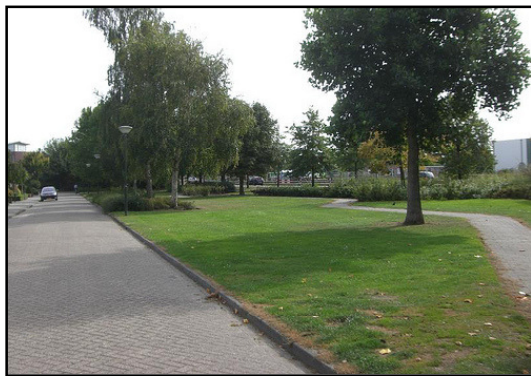
De oude Putten lagen ter hoogte van de Sluis bij dit parkje aan de Begoniastraat.