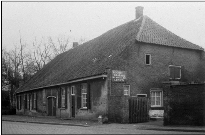
Tot 1953 stond op het leengoed Overaasche Hoeve [nu Kolonel Johnsonstraat] deze oude boerderij; bekend onder de benaming Koningshoeve naar de familie De Koning]. Volgens de muurankers dateerde dat pand uit 1693.

Het is de vraag of de goederen aan de Groenendaal in een eerdere periode werden aangeduid met de benaming Overaasche Hoeve (1379: Die hove van Overaa). 36 In de cijnsregisters van Helmond spreekt men in 1599 over “huijs ende hoff op Groenendael by St. Anthonis cappelle ende dorde part van den Groten Streep, ende eenen bempt genamp d’n Amer (Amert)” , echter die cijns wordt in de periode 1406-1421 nog beschreven als 1/3 deel van de Overaasche Hoeve (manso de