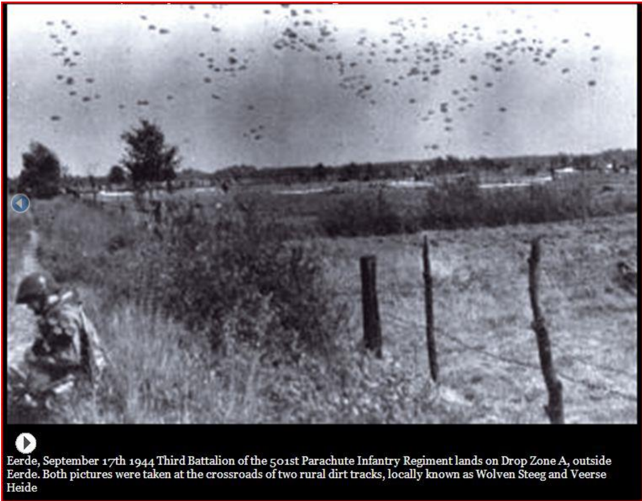
Eerde, September 17th 1944 Third Battalion of the 501st Parachute Infantry Regiment lands on Drop Zone A, outside Eerde. Both pictures were taken at the crossroads of two rural dirt tracks, locally known as Wolven Steeg and Veerse Heide

Foto -1- Bekende foto genomen op de kruising Wolvensteeg en Veerse Heide te Eerde.