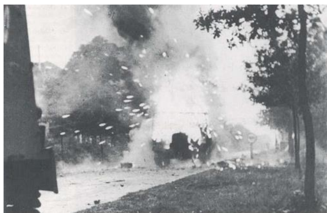
Foto -6- Weer een bekende foto. Tegen de avond van de 24 e september ontploft er dichtbij Koevering een Amerikaanse munitiewagen.

míttraïlleurvuur - een zuivering van de Amerikanen van het voorterrein - en verder een stille nacht.